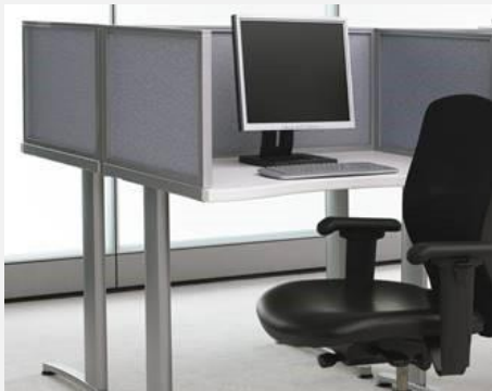
Séparateur en tissu fixe de Teknion 24''ou 30'' L / 15''ou 22'' H