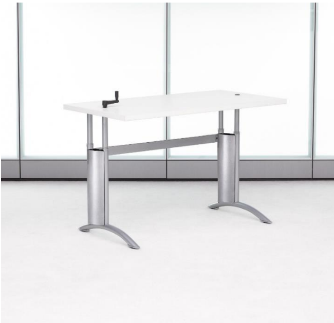
Modèle Expansion-Training de Teknion avec manivelle (PMR) Dimension minimale : 20''X 48'' / Dimension idéale : 24''X 60''