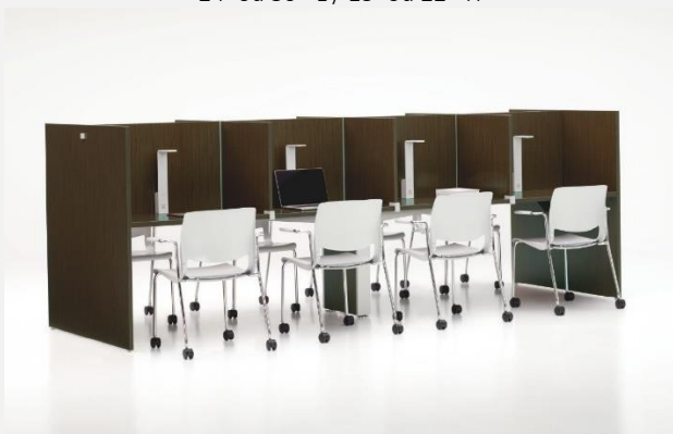
Cubicule « Thesis » - Isoir de mélamine de Teknion Table 24''X 30''ou 36''ou 42'' Séparateurs de 15''ou 22'' H