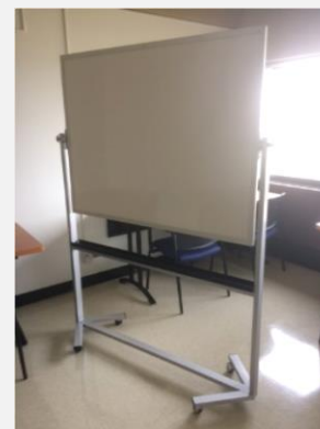
Modèle 606 – Scriptam 36''H X 48''L