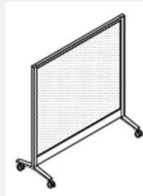
Écran « Ability » en tissu sur roulette - Teknion 51''H X 48''L