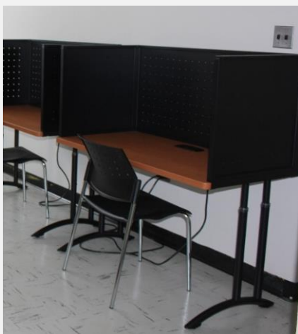
Cubicule « Training » Isoir de métal de Teknion Table 24'' x 30''ou 36''ou 42''ou 48'' Séparateurs 15''ou 22'' H